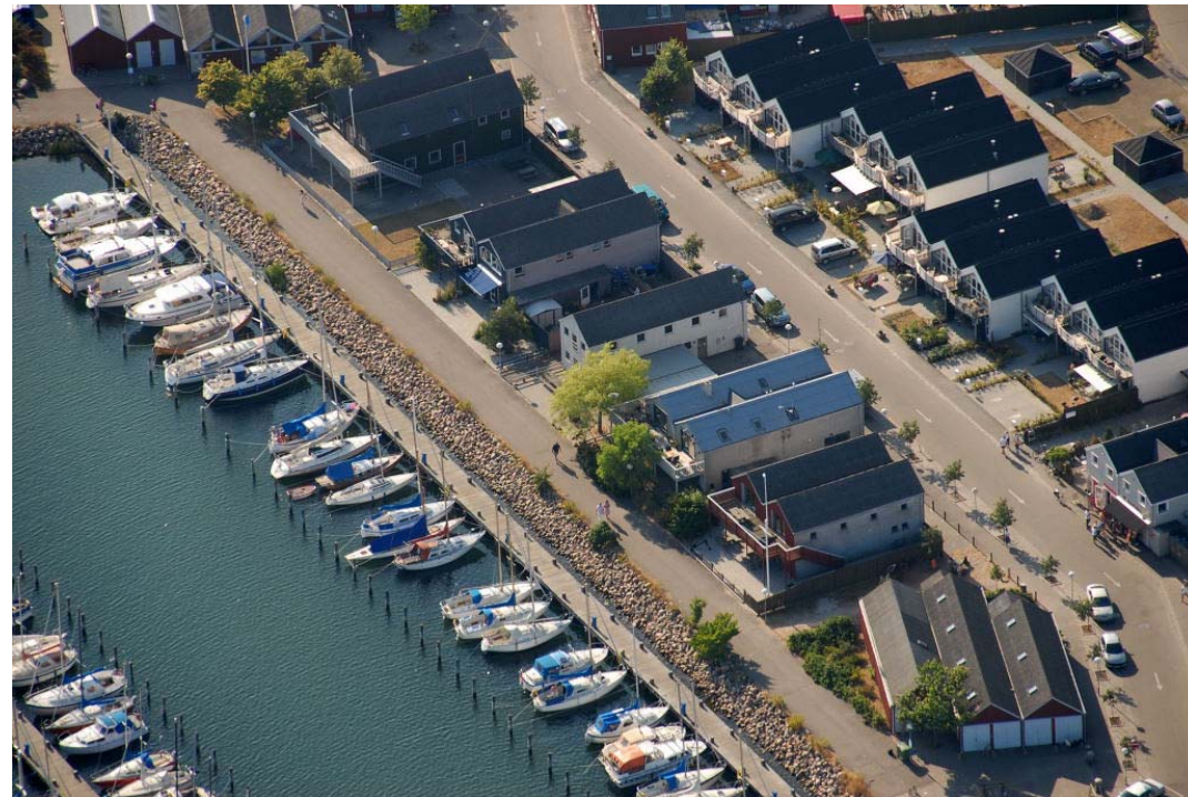
Klubhus lidt fra oven