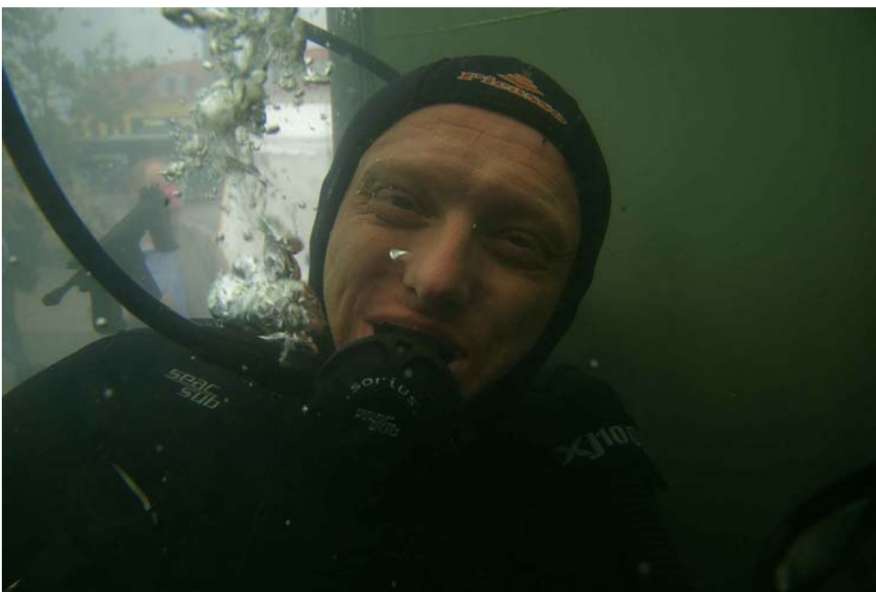
Dykker i tanken