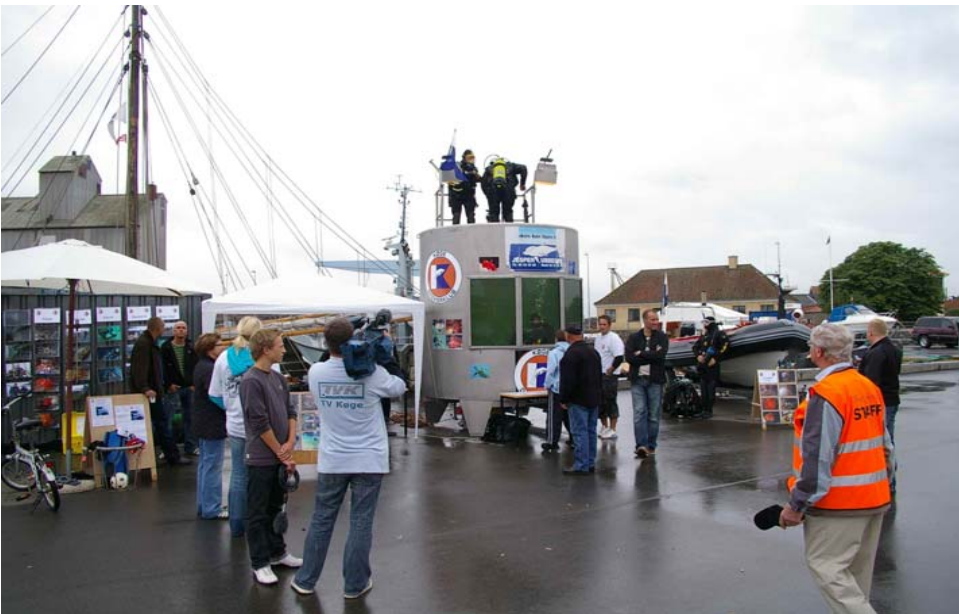
TV Køge på besøg ved Køge dykkerklubs stand under festugen