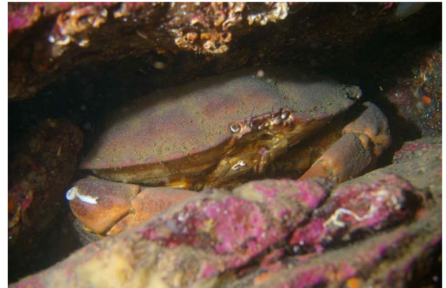
Billede fra Lysekile