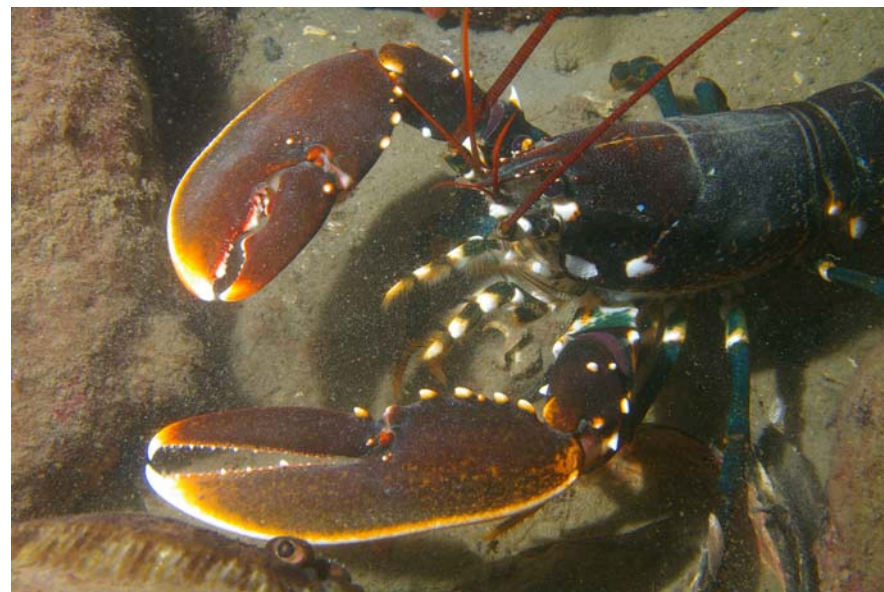
Billede fra Lysekile