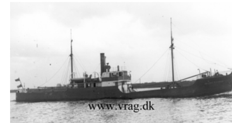
Dybde: Top 24m Bund 34

Torsdag den 8. Juni med gummibåd kl. 1700.