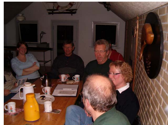
Livlig debat om hvor meget rengøring man kan få for 10 kr.