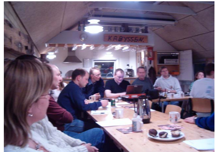
Livlig debat ved generalforsamlingen