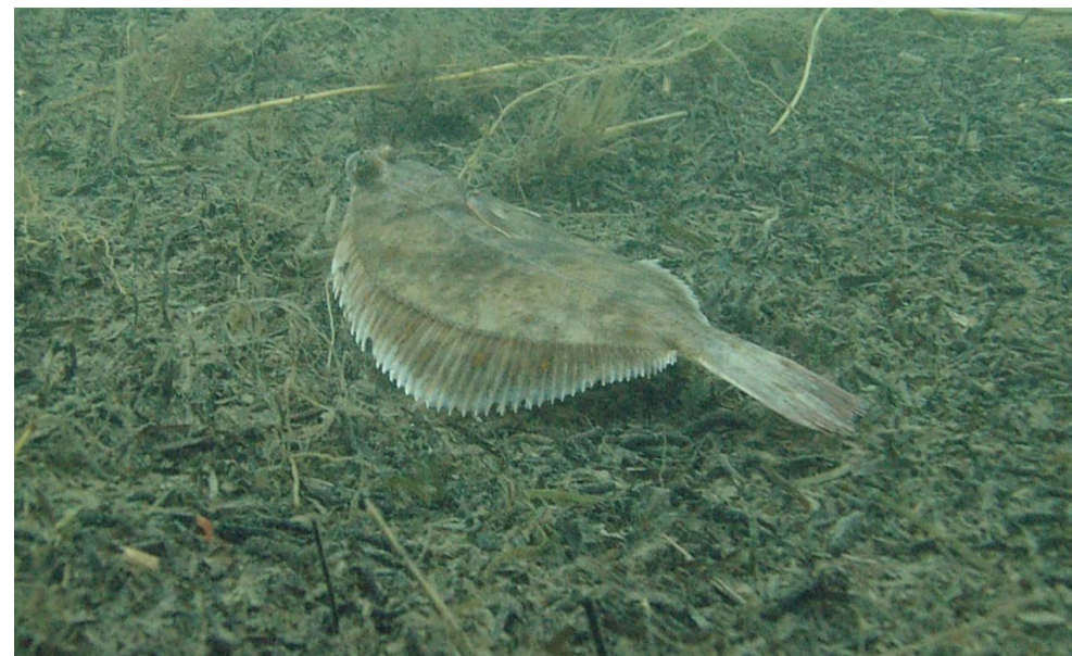
En enlig fisk i Køge lystbådehavn, fotograferet under Nytårsdykket