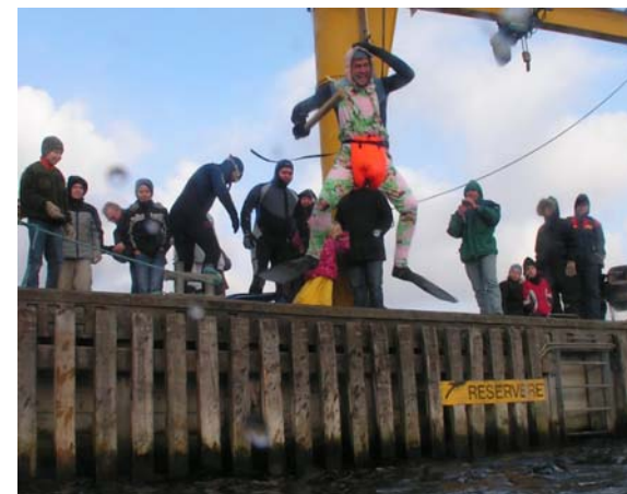
Billeder fra en sjov, kold og hyggelig dag