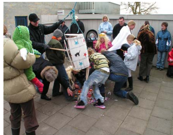
Der er kamp om slikket