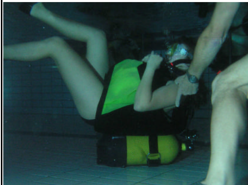
Mon kommandoen lød: lign en skildpadde!!...?