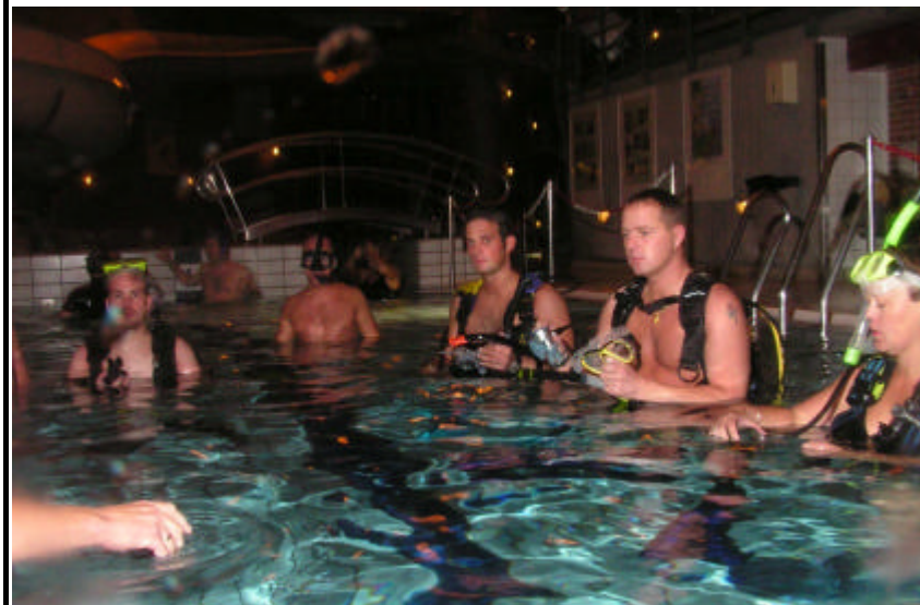
Der blev lyttet interesseret til instruktøren