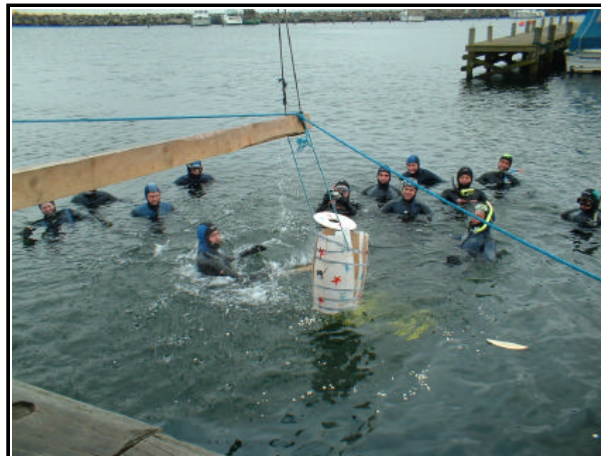
Det kan godt være svært at ramme...