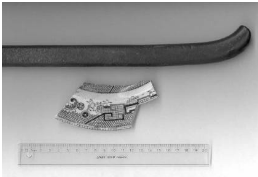
De to løstund tra vrage ved Storedal. En bronzegenle og et potteskår.