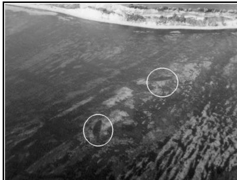
Aftegning af 2 vrage på kalkgrunden ud for Holtug på Stevns. Placeringen passer perfekt med Gundersens markering for Atlas og Stærkodder. Men Atlas ligger antagelig 4 km længere mod syd.

Vandmasserne væltede tilbage mod de danske, østvendte kyster på Stevns, Lolland, Falster og Bornholm. De smalle bæltter og Øresund, som var udstyret med en naturlig prop i form af Saltholm, bevirkede, at vandet ikke kunne komme ud igennem de naturlige passager og i stedet for skyllede ind over land i meterhøje bølger.